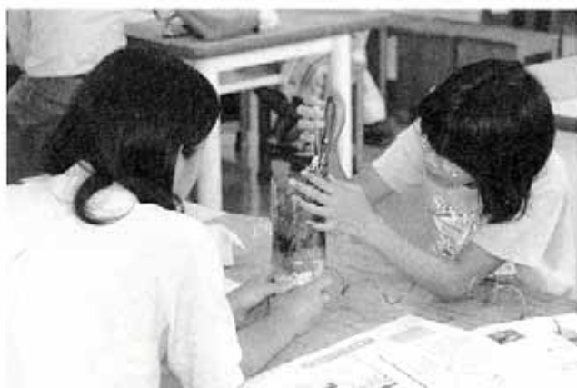
簡易ろ過装置作り