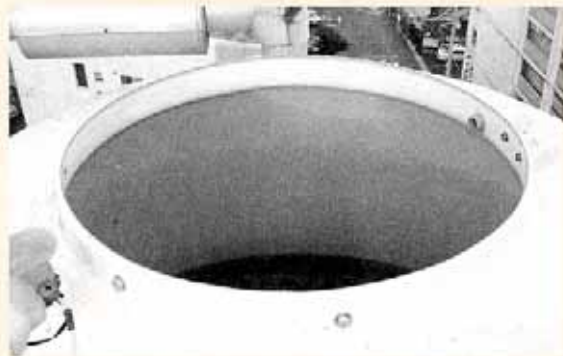
ふたの取れた貯水タンク

前号でお知らせしました「貯水槽水道衛生管理研修会」を10月1日に開催しました。平成15年に「貯水槽水道の維持管理の指導に水道局が積極的に関与すること」が定められてから、様々な広報をしてまいりましたが、研修会は今回初めての試みでした。